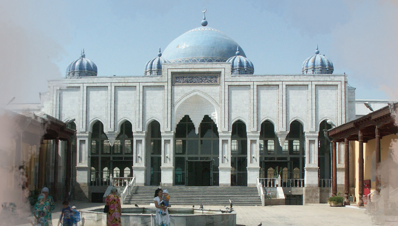
Одна из среднеазиатских мечетей, легко узнаваемых по куполам-гамбизам и полумесяцам