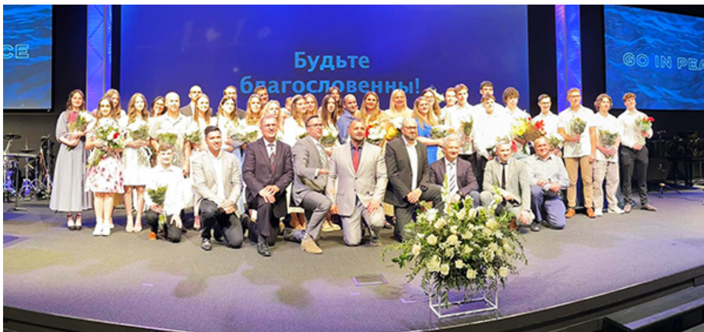
Пасторы и молодежь, принявшая крещение

Тридцать молодых людей вступили в завет с Господом 28 апреля во время объединенного служения русско- и англоговорящего потоков церкви Grace Family Church. Множество гостей, красиво украшенный подиум и баптистерий, свидетельства крещаемых – все это сделало служение радостным и очень праздничным. Подробнее о служении читайте здесь.