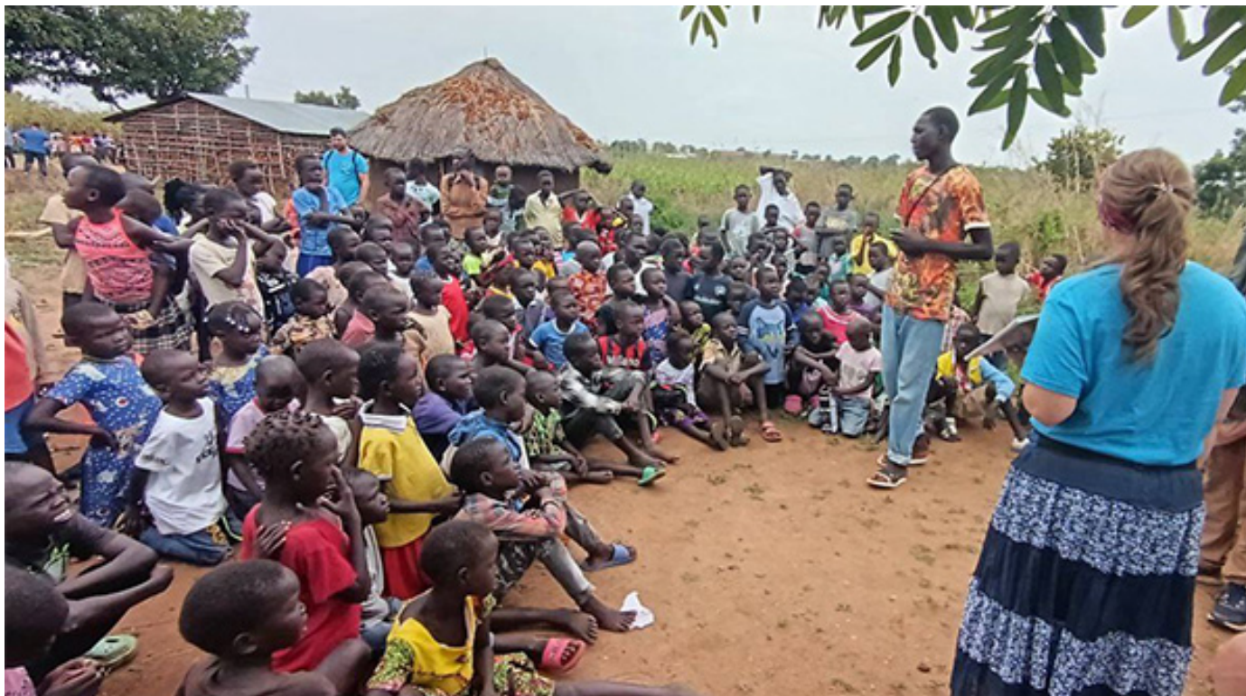
Служение детям беженцев