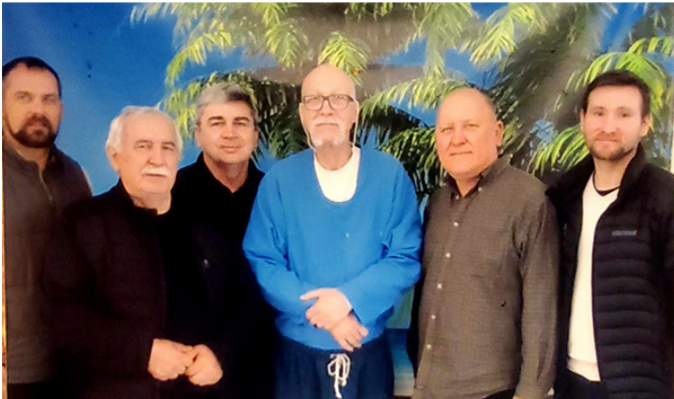
Одно из посещений...